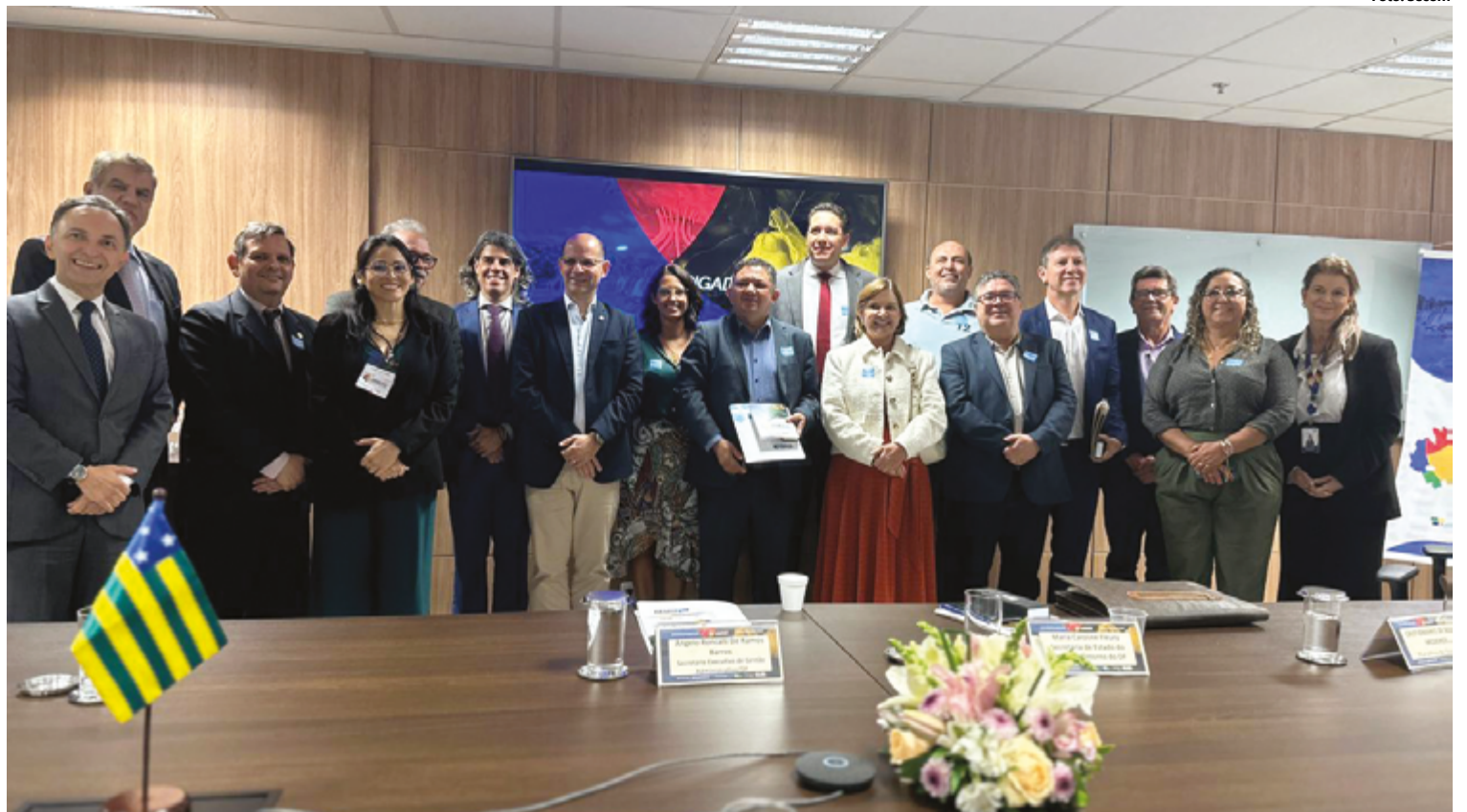
A secretária também chamou a atenção para o impacto dos recentes aumentos nas tarifas de transporte público

A secretária também chamou a atenção para o impacto dos recentes aumentos nas tarifas de transporte público e ressaltou a urgência de encontrar soluções mais imediatas para não sobrecarregar ainda mais a população do Entorno. Ela argumentou que, além de possíveis