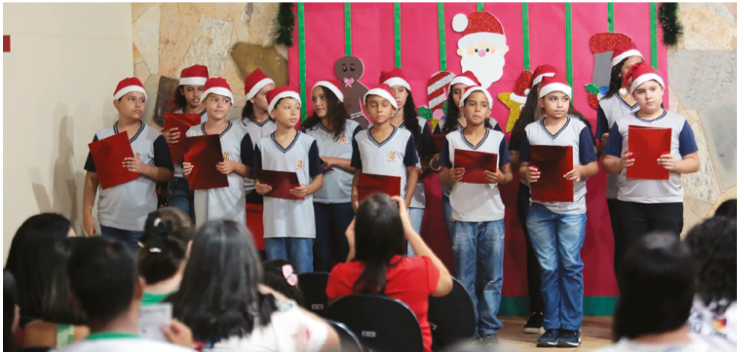
Alunos do Centro de Atendimento Municipal Educacional Especializado

O AMEE é realizado, prioritariamente, na Sala de Recursos