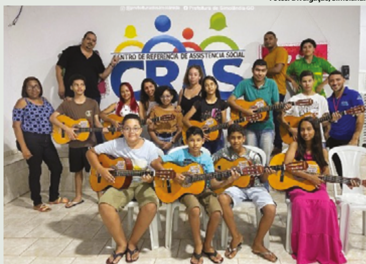
Se formaram aproximadamente 12 crianças e adultos

Além das técnicas musicais, as aulas de violão também reforçaram os laços sociais e vínculos afetivos, exercendo relevante papel na formação cul-