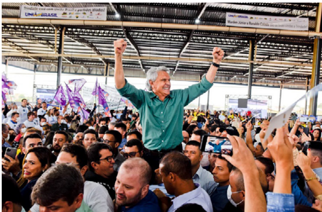
Ronaldo Caiado: gestão em Goiás turbinou popularidade do governador em todo o país

A coerência política de Caiado, aliada a sua competência na gestão do Estado, tem refletido diretamente na convicção dos eleitores goianos. Pesquisa de intenção de voto para presidente da República, realizada em Goiás pelo instituto Paraná Pesquisas, divulgada nesta terça-feira (12/12), aponta que Ronaldo Caiado superaria com folga a polarização política que domina o país desde 2018, e que divide o Brasil entre bolsonaristas e lulistas. Num