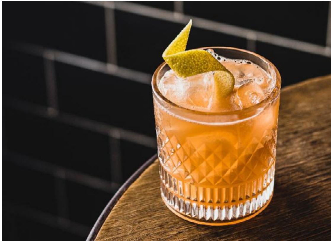
Clássico moderno: coquetel cai bem em paladares afeitos ao sabor do gim

da Pizzaria La Tavola. Note que em todos os estabelecimentos haverá esses drinques, o que denota fama ainda inabalada. De fama inabalada, entenda, bebidas que ultrapassam tendências, resistem ao tempo e continuam presença certa em bares, como todas as citadas nesta reportagem.