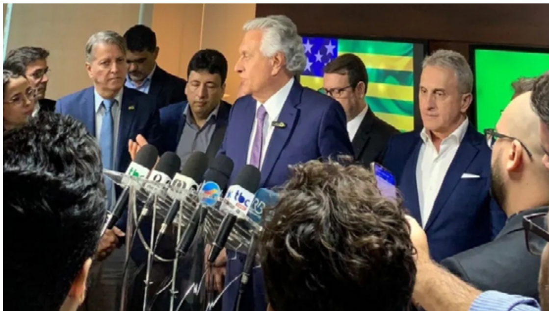
Ronaldo Caiado durante coletiva: “Será dado um prazo, se o estado não cumprir, o empresário irá ter o direito de ter a licença automática”

apresentou alguns dados do Instituto Mauro Borges, que apontam avanços significativos a respeito do crescimento econômico do estado.