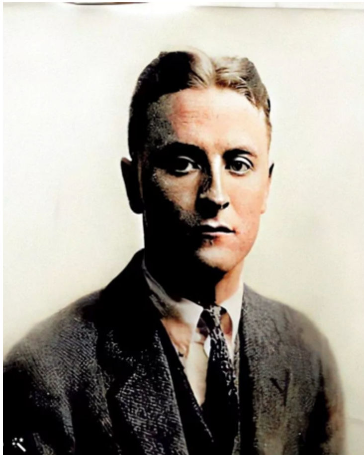
Scott Fitzgerald, escritor: homenageado

to, como fizera com "Este Lado do Paraíso" e "Belos e Malditos". Foi preciso que a história fizesse justiça à obra.