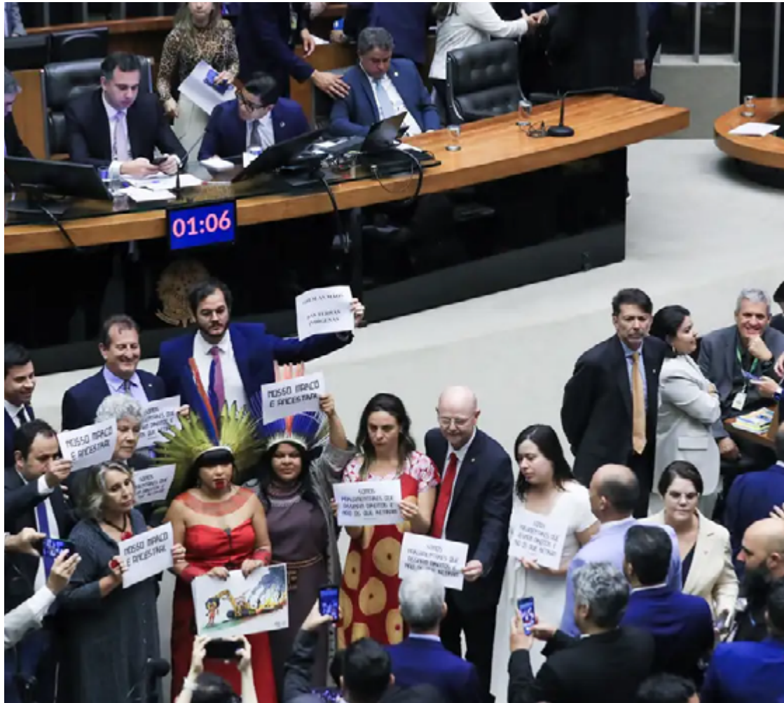
Medida havia sido vetada pelo presidente Lula com o argumento de ser considerada inconstitucional

O Ministério da Fazenda vinha defendendo que a desone-